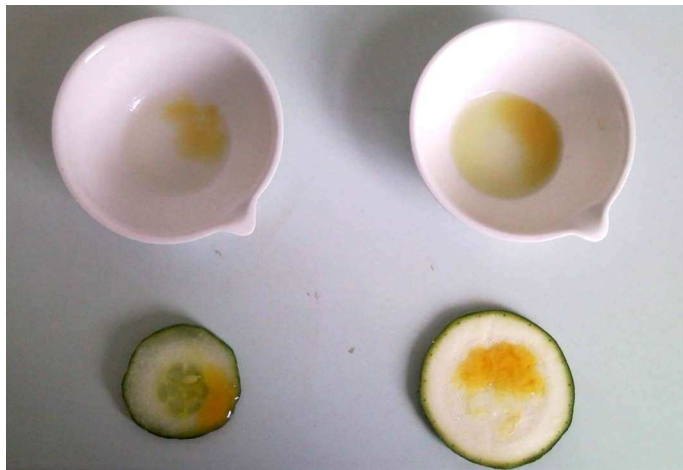
Abbildung 1: Test von Gurken- und Zuccinisajt und -früchten auf Stärke.